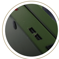
Hızlı Şarj Teknolojisi